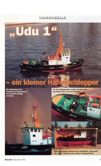
Ein Baubericht von Jürgen Jablonski finden Sie im Magazin ModellWerft September 1998